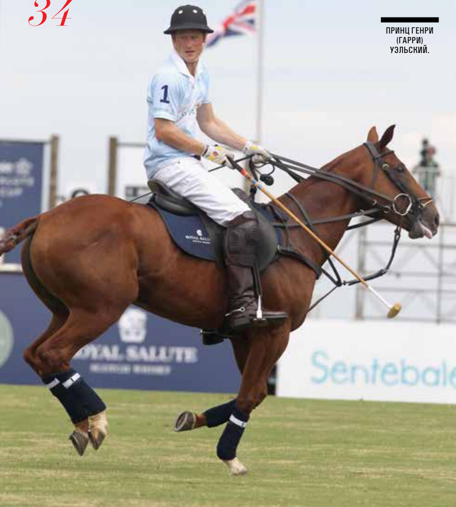
ПРИНЦ ГЕНРИ (ГАРРИ) УЗЛЬСКИЙ.

независимо от того, желают они этого или нет. Определяющую роль здесь играет умение держаться в седле: на невероятном по скорости галопе необходимо поистине виртуозное владение лошадью и одновременно — клюшкой, чтобы забить как можно больше мячей в ворота соперников. В момент нанесения удара по мячу всадник управляет своим скакуном одной только левой рукой.