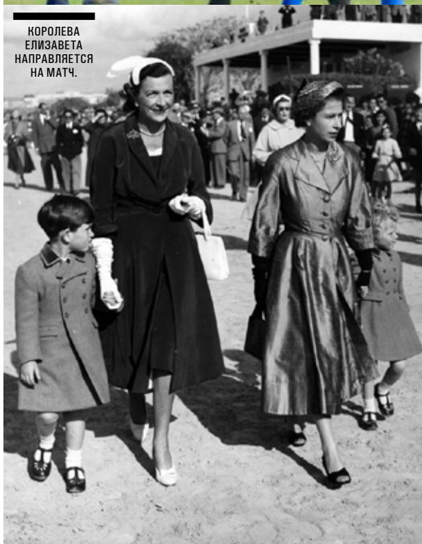
КОРОЛЕВА ЕЛИЗАВЕТА НАПРАВЛЯЕТСЯ НА МАТЧ.

Азербайджан имеет большую историю в спорте човган, который существует здесь на протяжении веков. Тогда как поло в его современном варианте в стране еще не прижилось. Этой осенью Азербайджан празднует премьеру поло, и спорт возвращается к своим корням. Под лозунгом «Возвращение поло на родину» в период с 6 по 8 сентября в Баку на Кубке Мира Арена Поло 2013 выступят друг против друга 4 международные команды из Аргентины, США, Европы и Великобритании. Местом проведения является недавно построенное открытое поле арена-поло в Elite Horse Club в Конном центре Бина. Среди основных этапов мероприятия необходимо упомянуть товарищеский матч между двумя смешанными командами, сочетающими