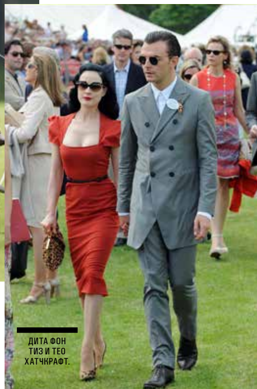
ДИТА ФОН ТИЗ И ТЕО ХАТЧКРАФТ.