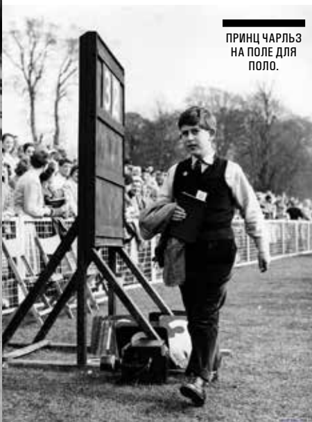
ПРИНЦ ЧАРЛЬЗ НА ПОЛЕ ДЛЯ ПОЛО.

ми игроков човган Азербайджана и международных игроков поло, что произойдет впервые в истории этого спорта и напомним всем о корнях поло в Азербайджане. Трехдневный турнир представляется известной в Азербайджане продовольственной компанией Milla, а за производство и организацию отвечают швейцарская компания World Polo GmbH и местный партнер.