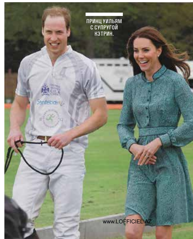
ПРИНЦ УИЛЬЯМ С СУПРУГОЙ КАТРИН.