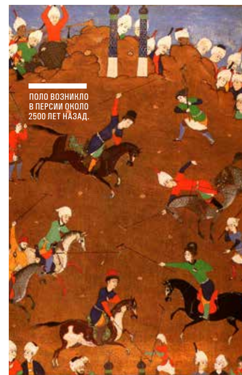
ПОЛО ВОЗНИКЛО В ПЕРСИИ ОКОЛО 2500 ЛЕТ НАЗАД.